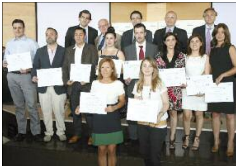
Foto de familia de los premiados.