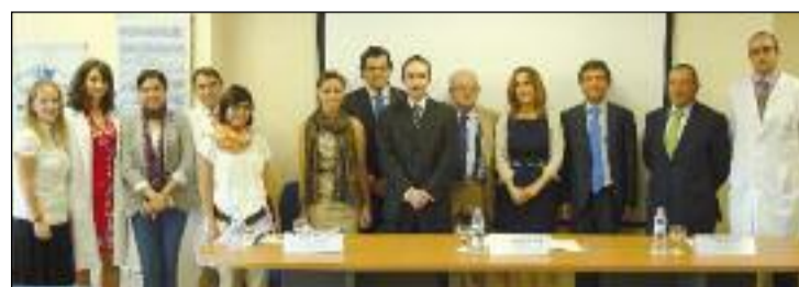
Los nuevos MIR, algunos residentes de 2010 y miembros de HM Hospitales tras el acto de bienvenida.

MIR EN PEDIATRÍA, GINECOLOGÍA Y ONCOLOGÍA