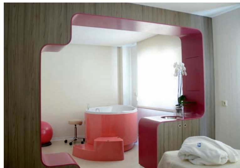
Habitación de Parto Natural en HMB

Asimismo, el personal de la planta de Maternidad asistirá a las madres después del parto, prestando especial atención en favorecer el contacto precoz, la creación del vínculo madre-hijo y apoyar la lactancia materna.