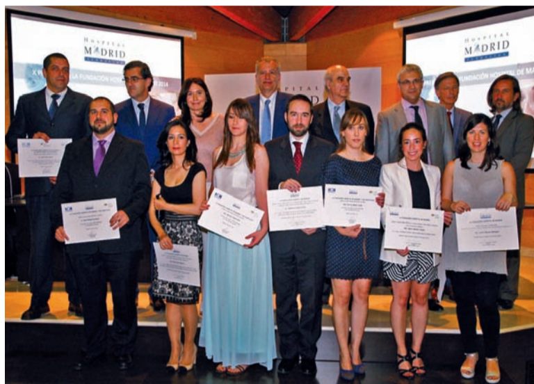
Foto de familia con todos los premiados