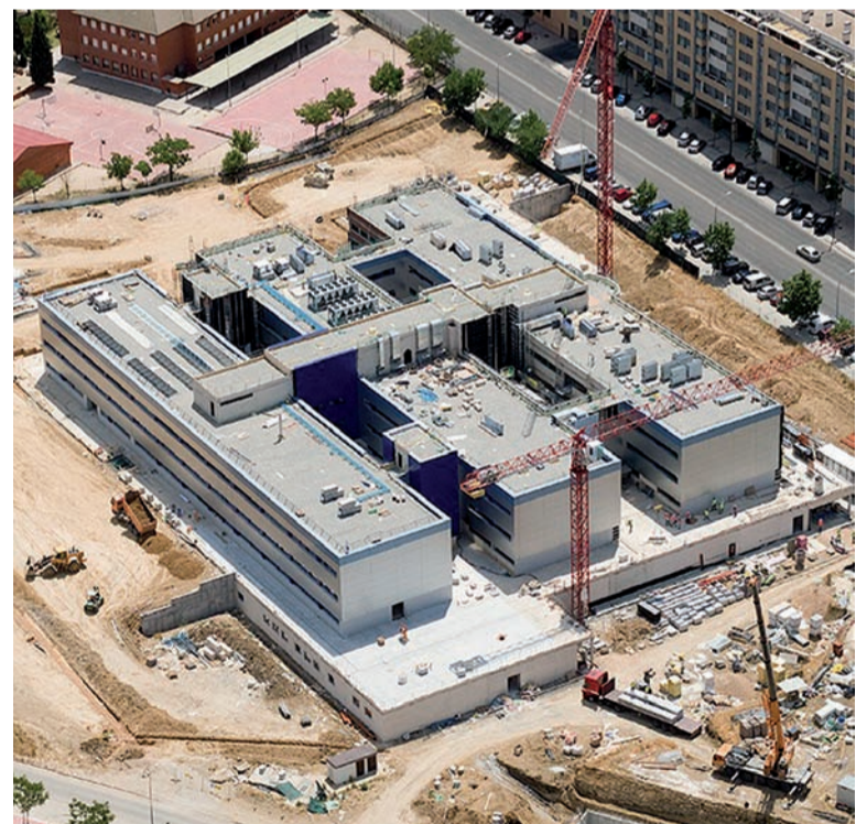
Estado de las obras de HM Universitario Puerta del Sur

Además, albergará el Centro Integral de Neurociencias A.C. (CINAC), un proyecto pionero, innovador y vanguardista, que integrará la actividad asistencial con la docente e investigadora para personalizar la atención sanitaria (Medicina Personalizada) e individualizar el tratamiento, utilizando las tecnologías más modernas y los últimos avances de la ciencia (biología molecular y genética, nuevas dianas terapéuticas, sensibilidad/resistencia al tratamiento, nuevas terapias biológicas, etc). El CINAC será un centro de referencia nacional en Neurociencias para el diagnóstico y tratamiento de las enfermedades neurodegenerativas, neurofuncionales y psiquiátricas, así como en investigación e innovación de las mismas, y estará a la vanguardia en innovación de cirugía del comportamiento y Psiquiatría. Todo ello, dirigido a los pacientes de HM Hospitales y de la Comunidad Autónoma de Madrid.