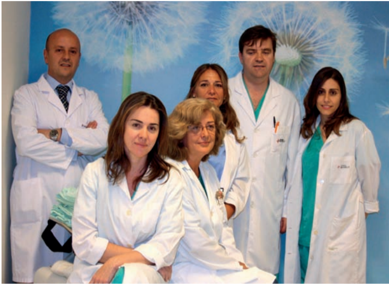
Miembros de la Unidad de Mama del Hospital Modelo

La Unidad de Mama del Hospital HM Modelo (A Coruña), recientemente integrado en HM Hospitales, ha sido aceptada en la Breast Centers Network, la primera red internacional de centros dedicados en