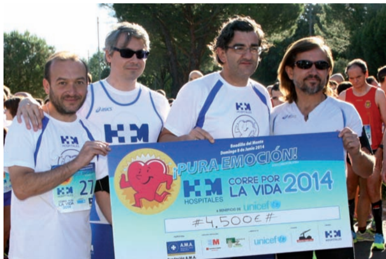
4.500 euros fueron donados a Unicef

Respecto a los beneficios externos, los usuarios con tarjeta de HM Hospitales tienen un 10 por ciento de descuento sobre las tarifas vigentes de los centros del Grupo Sanyres. Estas ventajas se unen a las otras empresas que ofrecen descuentos y condiciones mejoradas a los portadores de nuestra Tarjeta de Usuario, como Fempsa, Pequeñas Miradas, Prim, RV Alfa, Visionlab, etc. Puedes informarte ampliamente de los detalles de estos beneficios accediendo al Portal del Paciente de nuestra web, www.hmhospitales.com .