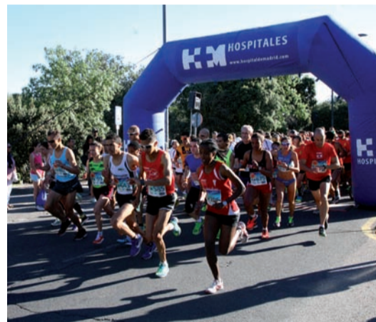
Los participantes en el inicio de la carrera

El 8 de junio tuvo lugar la V Carrera Popular Solidaria HM Corre por la Vida, en la que se inscribieron cerca de 1.000 personas. La iniciativa, organizada por HM Hospitales, patrocinada por la Fundación A.M.A. y con el apoyo institucional de la Comunidad de Madrid y el Ayuntamiento de Boadilla del Monte, comenzó a las 09:00h, partiendo de HM Universitario Montepríncipe (HMM), y recorrió 10 kilómetros repartidos entre asfalto y tierra, en un trayecto nivelado y compensado en subidas y bajadas, bastante favorable para los corredores y con muy buena aceptación por parte de los mismos, que terminó en el campo de fútbol contiguo al hospital. Un año más, la carrera recaudó fondos a favor de la infancia a través de la donación de sus beneficios a Unicef, que ascendió a la cantidad de 4.500 euros.