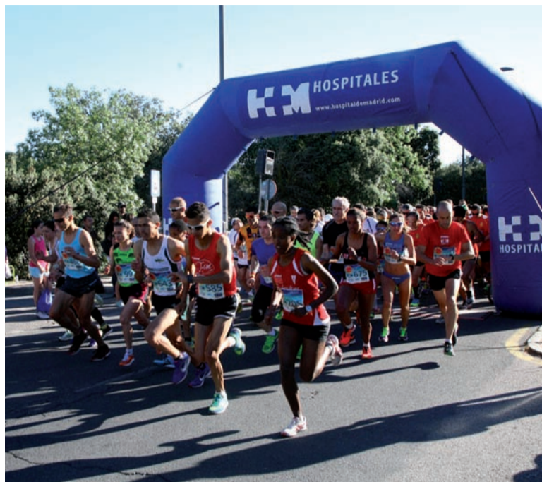
Los participantes en el inicio de la carrera

El 8 de junio tuvo lugar la V Carrera Popular Solidaria HM Corre por la Vida, en la que se inscribieron cerca de 1.000 personas. La iniciativa, organizada por HM Hospitales, patrocinada por la Fundación A.M.A, y con el apoyo institucional de la Comunidad de Madrid y el Ayuntamiento de Boadilla del Monte, comenzó a las 09:00 h, partiendo de HM Universitario Montepíncipe (HMM), y recorrió